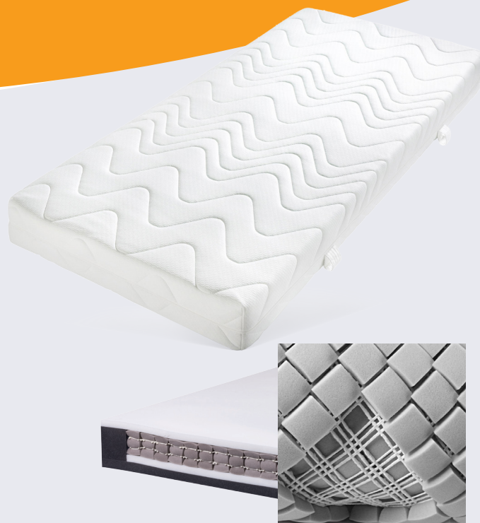
Het Prefita Touch dementiematras bestaat uit 1600 impulsgevers die zorgen voor een verbeterde lichaamswaarneming.

Mensen met dementie verliezen al na een paar minuten het lichaamsgevoel dat wij 'liggen' noemen. De Prefita Touch dementiematrassen zorgen ervoor dat dit besef langer blijft, waardoor de kwaliteit van het slapen en daarmee ook de kwaliteit van het leven progressie boekt. De basis van het Touch systeem ligt in het inwendige matras. Deze is voorzien van kubusvormige elementen van traagschuim, die als een raster met elkaar in verbinding staan: de impulsgevers. Elk matras bestaat uit zo'n 1600 impulsgevers die zorgen voor een verbeterde lichaamswaarneming. Het lichaam krijgt kleine reactie-impulsen bij elke lichaamsbeweging. Zo blijft de patiënt zich bewust van de liggende houding en zal langer blijven liggen. Het hoogwaardige, zachte schuim zorgt voor comfort en een goede luchtdoorlating. Het verbeterde microklimaat komt de intensiteit van de slaapcyclus ten goede. Het matras is ook effectief inzetbaar om doorliggen te voorkomen.